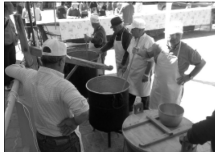
I "casari" di Frosolone all'opera

La manifestazione è stata organizzata dalla pro loco per far consentire ai turisti di vedere con i propri occhi in che modo avviene la lavorazione del formaggio. I casari del posto hanno cominciato a lavorare di buon mattino per regalare a tutti autentici capolavori ricavati dal latte: cagliata, ricotta, caciocaval-