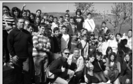
Gli studenti di badolato in visita ad Agnone

Gli alunni, gli insegnanti e la dinamica dirigente della Scuola