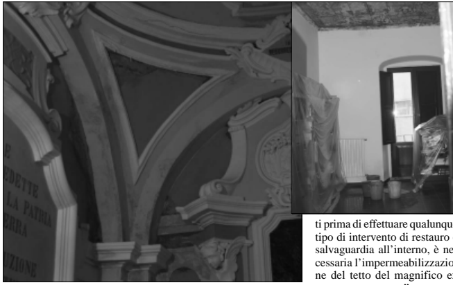
Infiltrazioni d'acqua a Palazzo San Francesco

La lettera è partita via fax venerdì scorso e già lunedì (oggi) da Campobasso un funzionario della Soprintendenza Storico Artistica si è recato nella monumentale sede della Biblio-