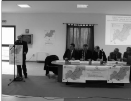
Un momento del convegno. Nel riquadro Michele Iorio

FROSOLONE. Verrino - Fresilia - Rivolo, la Regione dice sì alla realizzazione della strada che rivoluzionerà la viabilità interna molisana. L'impegno è stato preso da Michele Iorio in persona che ha partecipato all'importante convegno organizzato dall'amministrazione comunale di Frosolone. Il presidente Iorio ha inoltre ribadito che la Regione reperirà le risorse non solo per terminare la Fresilia ma anche quelle per completare il Verrino in direzione dell' l'Abruzzo rassicurando il Sindaco di Agnone presente al convegno. L'iniziativa dell'amministrazione comunale è stata un successo e ha riscosso grandi apprezzamenti con la partecipazione di numerose autorità, politiche, religiose e imprenditoriali. Costi di realizzazione - secondo uno studio preliminare - per il completamento dei sette chilometri che congiungeranno il Molise trasversalmente da Nord a Sud, circa trenta milioni di euro. Un'opera già avviata con la realizzazione del primo e del secondo lotto della Fresilia e completa ormai per i tre quarti. Ebbene, con il completamento del terzo lotto con sbocco in località Sprondasino,