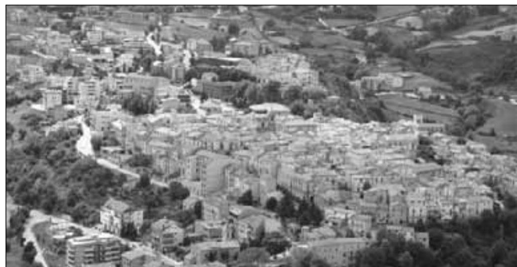
Una veduta di Frosolone. Sopra una delle manifestazioni dell'estate frosolonese